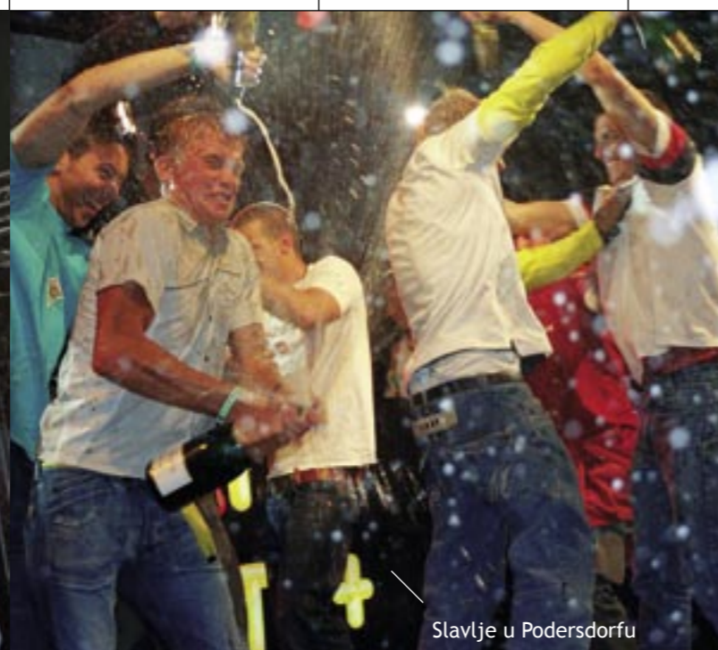
Slavlje u Podersdorfu