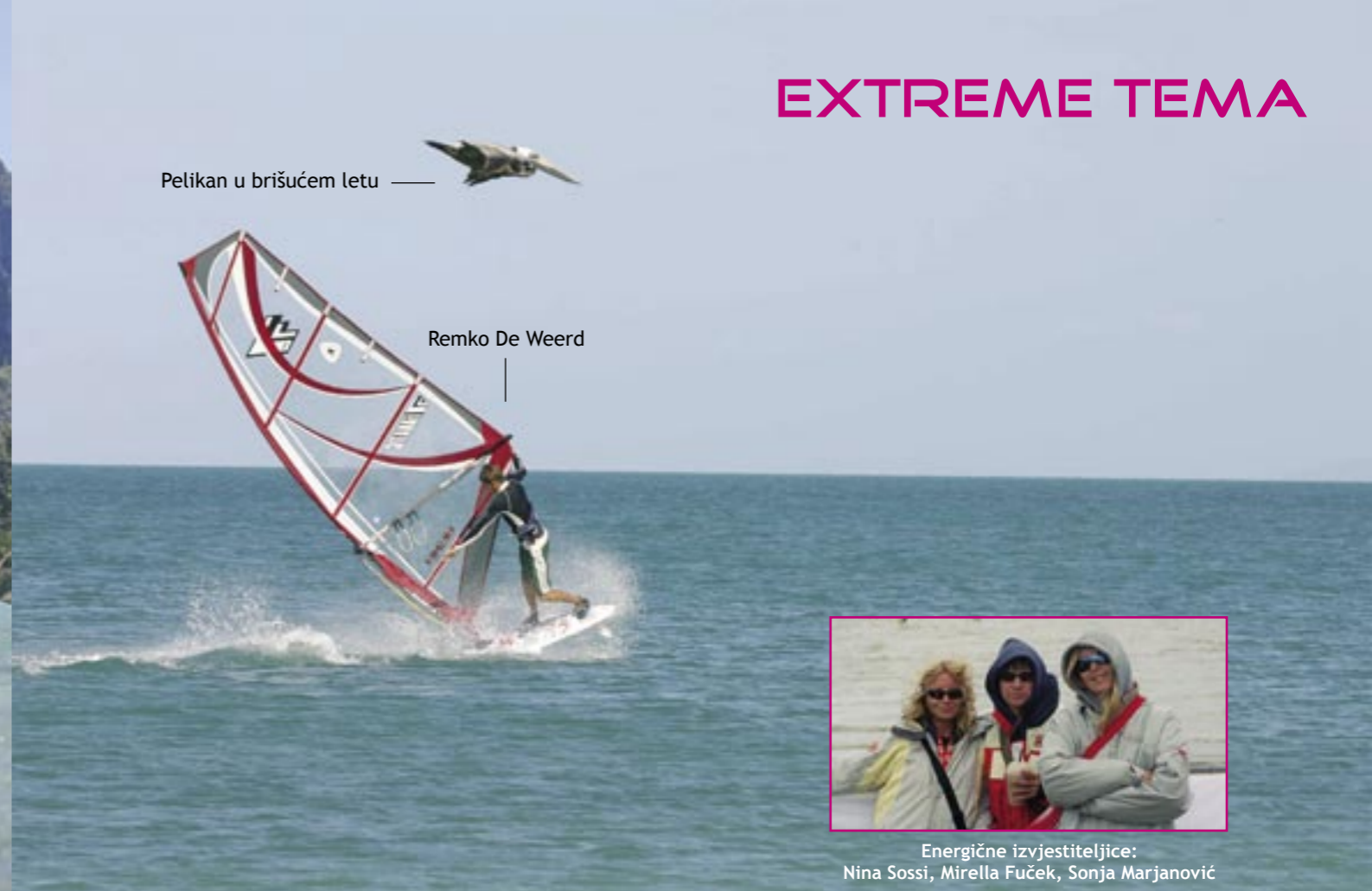
Pelikan u brišućem letu