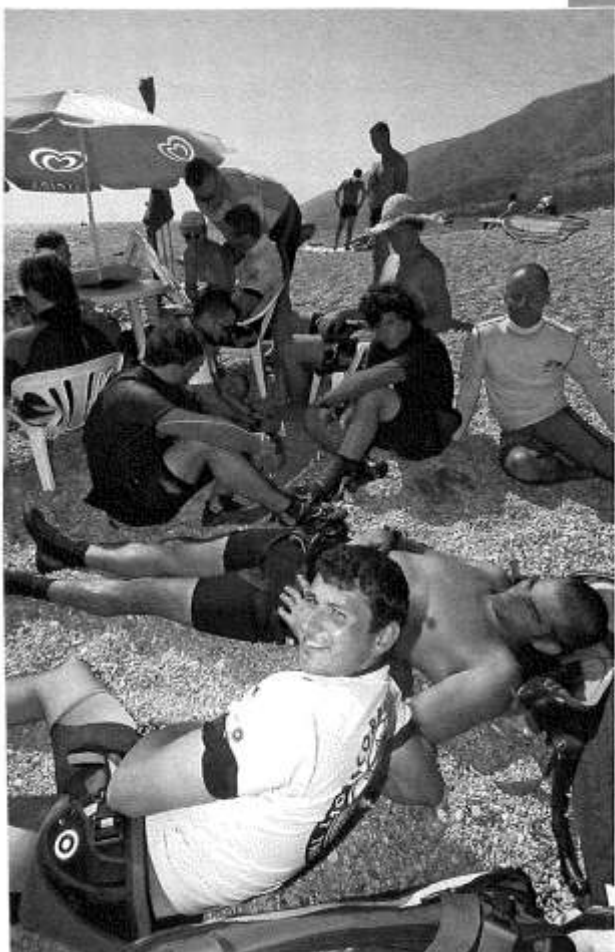
Slalomaši u čekanju vjetra