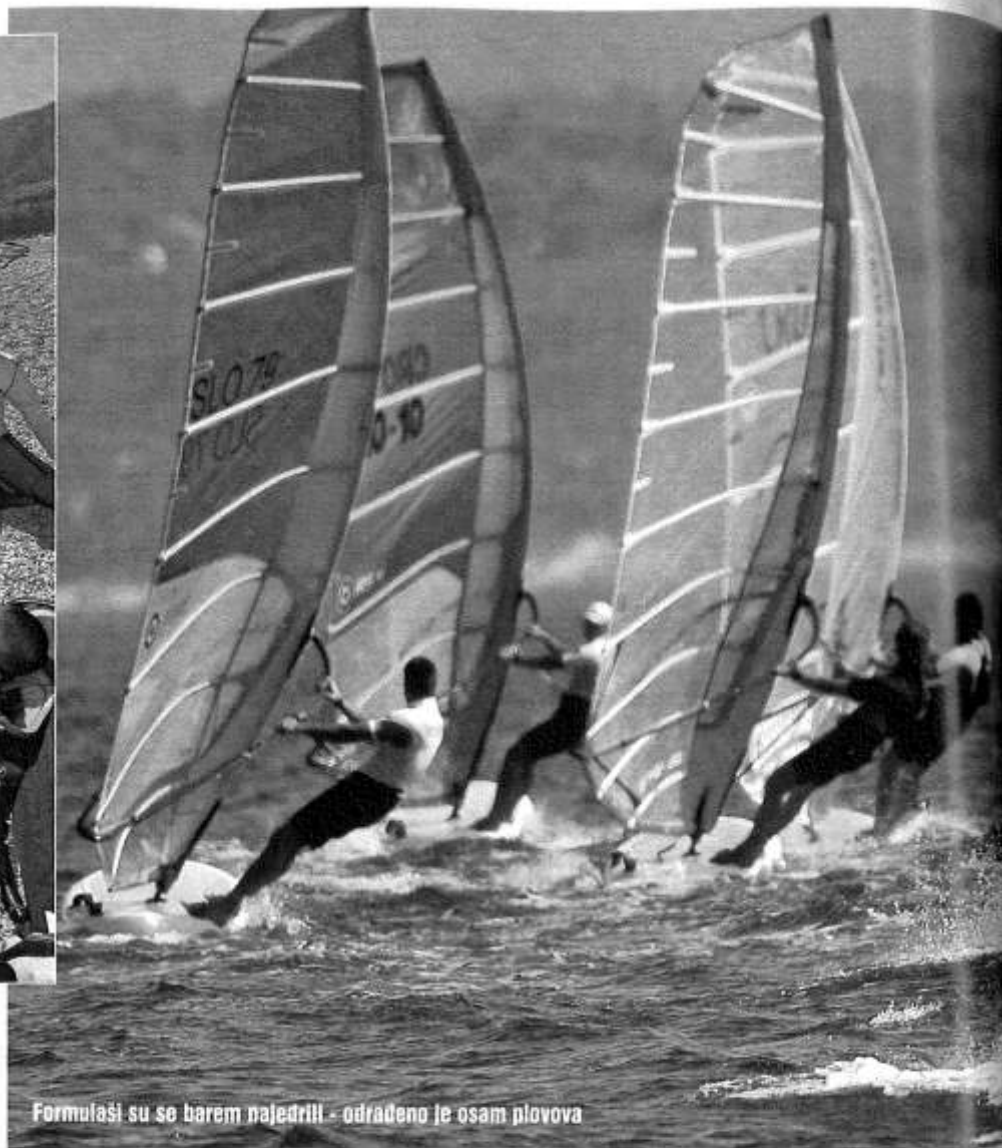
Formulaši su se barem najedriili - odrađeno je osam plovova